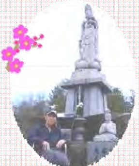
利用中、毎日お参りに行かれるこじか観音