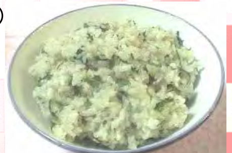
炊きあがったご飯によもぎを混ぜれば