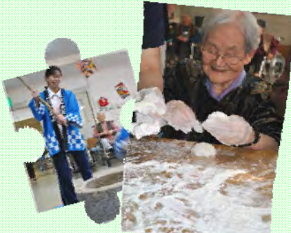
お餅は丸く仕上げましょう！