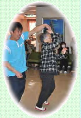
軽快なダンスは必見です！