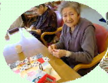
細かい作業もお手の物！