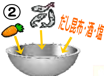
お米の中に、みじん切りの人参、じゃこ、調味料を入れる