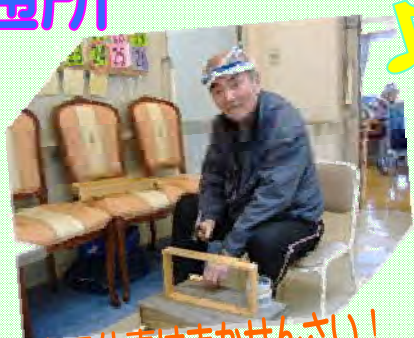
大工仕事はまかせんさい！