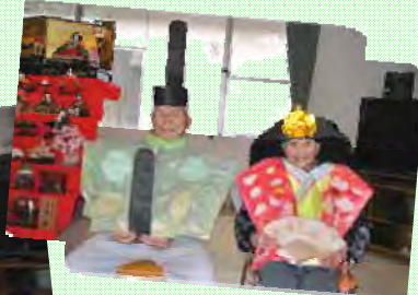
美男美女のすまし顔！