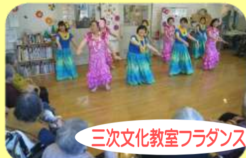
三次文化教室フラダンス

見ていると自然に体が動き出す。皆さんの踊りは魅力的で、本当に素晴らしいかったです。