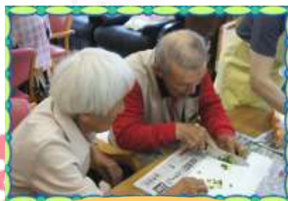
包丁じゃない! ワシの腕がいいんで~