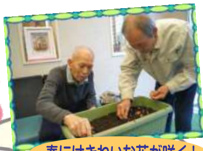
春にはきれいな花が咲く!