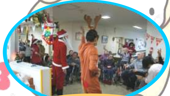
みんなでクリスマスを楽しもう!