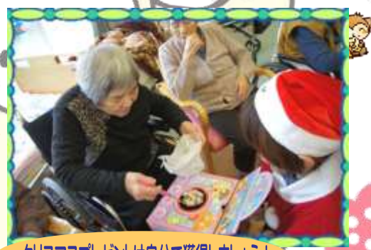
クリスマスプレゼントは自分で獲得しましょう!