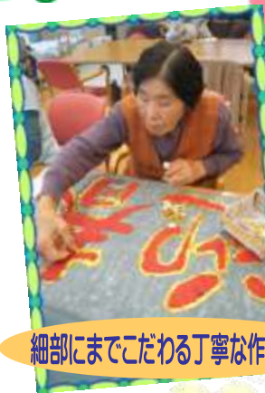
細部にまでこだわる丁寧な作業です