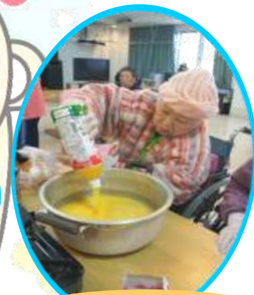
本日のおやつはパバロア作ります!