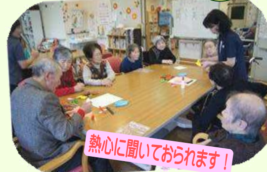
熱心に聞いておられます!