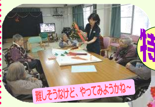
難しそうだけど、やってみようかね~