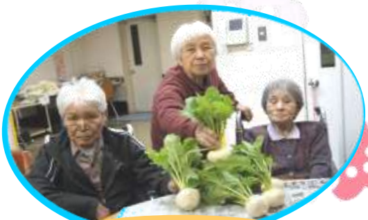
こじか荘の畑でカブ取ったど~!