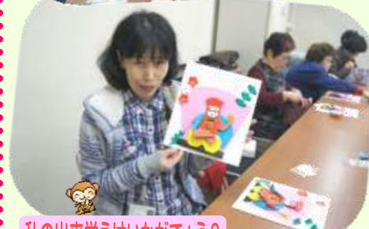
私の出来栄はいかがでしょうか?