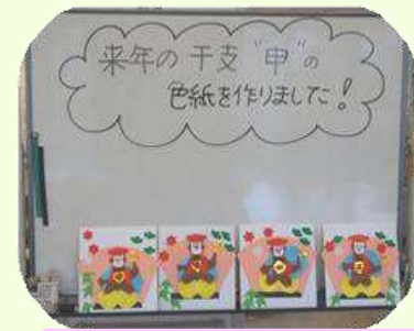
どれも味わいがあってええですね~