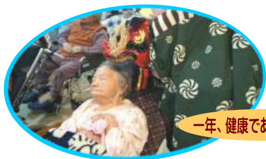
一年、健康でありますように!