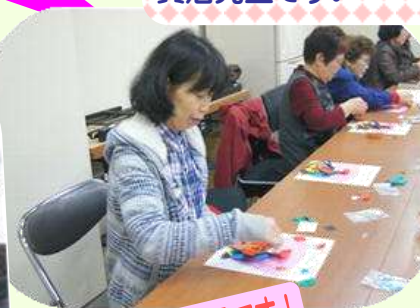
完成までは指先との真剣勝負です!