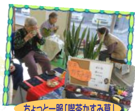
ちよつと一服「喫茶かすみ草」