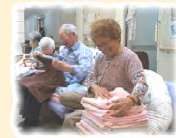
和やかに タオルたたみ