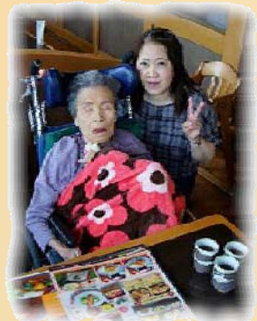
生きがいライブ (さざん亭)

清々しい初夏を迎え、穏やかな晴天の続く外出はもつてこいの季節になりました。今年もご利用者の思いや願いを実現することと、楽しみのある生活に繋げていくことを目的とした「夢を叶えます企画」を実施しています。 外出を通してご利用者の夢や想いをかたちにし、楽しみのある生活をお届けしていきたいと思っております。