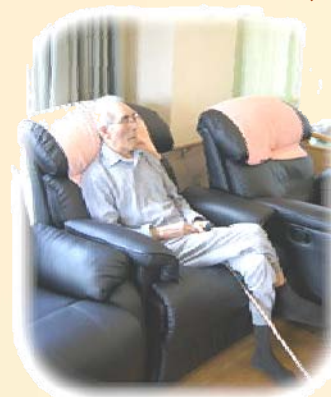
ちょっとひと休み