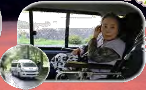
生きがいドライブ